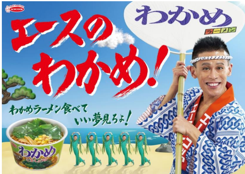
わかめラーメン ごま・しょうゆ/ごま・しお 三島のゆかり仕立て/ピリ辛みそ